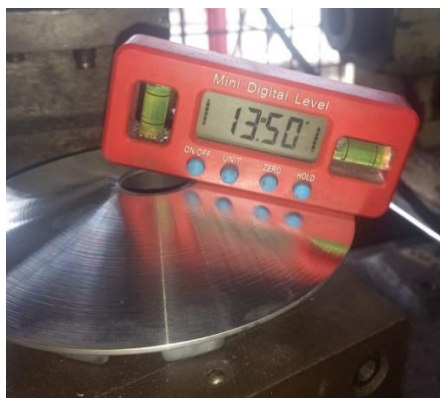
Gambar 1. Primary pulley yang telah dibubut

Primary pulley merupakan komponen utama dalam sistem CVT yang bertugas menjepit V-belt dan mengatur perbandingan rasio transmisi. Pada Yamaha Aerox 155, sudut pulley standar adalah 14^\circ , dan modifikasi ke sudut 13,5^\circ dilakukan dengan tujuan mempercepat pembukaan diameter pulley sehingga performa mesin dapat ditingkatkan [12]. Dengan sudut yang lebih kecil, fixed sheave dan sliding sheave akan lebih cepat menjepit V-belt , yang berpotensi meningkatkan torsi dan daya pada putaran rendah hingga menengah [13]. Kemiringan sudut pada primary pulley sangat mempengaruhi performa sepeda motor, terutama dalam aspek akselerasi dan efisiensi penyaluran tenaga. Jika sudut pulley dibuat lebih curam, V-belt akan lebih cepat berpindah ke diameter luar pulley sehingga meningkatkan respons akselerasi dari kondisi diam atau kecepatan rendah, yang berdampak langsung pada peningkatan torsi dan efisiensi transmisi tenaga dari mesin ke roda [14]. Sebaliknya, sudut pulley yang lebih landai dapat menyebabkan perubahan rasio berlangsung lebih lambat dan berpotensi menurunkan performa mesin pada kondisi tertentu, seperti saat menanjak atau menyalip. Rancangan perubahan sudut primary pulley standar dari 14^\circ menjadi 13,5^\circ melalui proses pembubutan ditunjukkan pada Gambar 1, yang mengilustrasikan modifikasi geometris yang diharapkan mampu mengoptimalkan kinerja transmisi CVT.